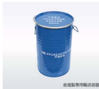
金属製専用輸送容器